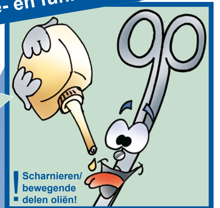
Visuele- en functionele controle