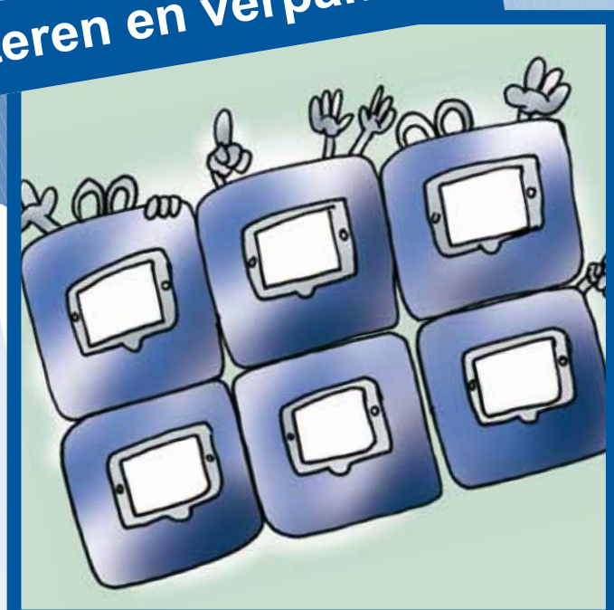
Sorteren en verpakken